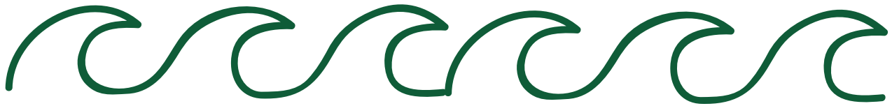
TABLE DES MARÉES