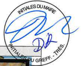
Avant la modification